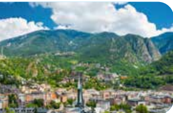
Valle de Ordino